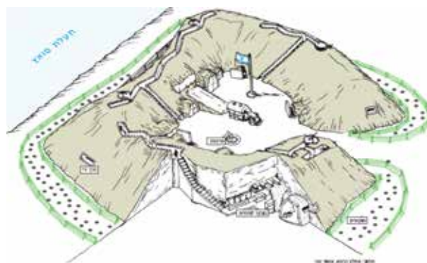
סכמת מבנה של מעוז בקו התעלה

"הפעולה (המצרית) הבולטת מבין הפעולות היוזמות באותה תקופה הייתה ההתקפה על הלשון של פורט תאופיק. ישראל השתמשה בפורט תאופיק כבסיס לפעולות ההפגזה נגד הנמלים של סואץ ושל עדבייה. הפעולה בוצעה בליל 9 ביולי 1969. הכוחות המצריים הצליחו לפגוע בשלושה טנקים ישראליים. את הפעולה הזאת ביצעו כוחות השייכים לארמיה השלישית, שהוקמה במסגרת בנייתם מחדש של הכוחות