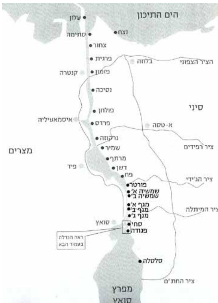
מפת המעוזים במלחמת ההתשה - 1970

המזוינים. זו הייתה פעולתה הראשונה של ארמיה זו. כוחות קומנדו מצריים שוב חצו את התעלה ותקפו מוצבים ישראליים. ב-30 ביוני 1969 ישראל גמלה בהפצצת תחנת המתח הגבוה ליד העיר סוהאג. כבר אז הזהיר משה דיין, שר הביטחון, שהפעולות הישראליות לא יישארו בגדר תגובות הגנתיות מוגבלות, אלא עשויות להתבצע בדרך שונה לגמרי.