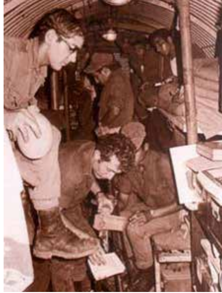
חיילים בבונקר במעוז

תחת אש ארטילריה מצרית. 5 פצועים פונו משדה הקרב על ידי מסוקים. בפעולה נהרגו 21 מצרים. לנו היו 4 הרוגים ו-17 פצועים. על מבצע "ויקטוריה" הייתה ביקורת בשל האבדות. הפעם היה תחת ביקורת מי שהרבה לבקר עד כה מבצעים אחרים, האלוף אריאל שרון. למרות שקבע כי המבצע השיג את יעדיו, החליט הרמטכ"ל להמשיך ולהפעיל בגזרה בעיקר את חיל האוויר. לבד ממבצע "ויקטוריה" בוצעו עוד כמה פעולות בעומק. תרומת מבצעי "סרג'נט" ו"ויקטוריה" לא הייתה רבה ולא השפיעה לדעת הרמטכ"ל על הקרב בתעלה, כמו הפשיטות על עדביה והאי גרין בשנת 1969. ואכן לא בוצעו יותר פעולות כאלה.