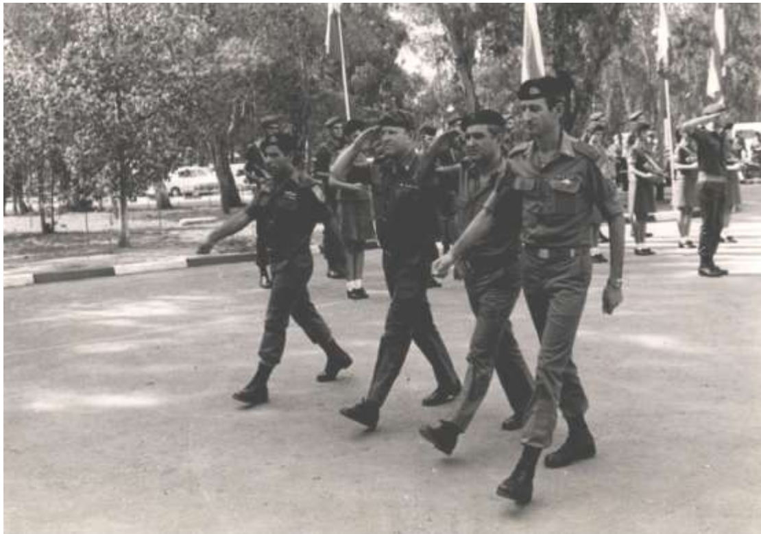
חילופי הקחש"ר 1983

שיוכפף חיל החימוש לאג"א לא יהיה משקל הולם לשיקולים המקצועיים של החיל ומשמעות הגדרת הקחש"ר כ'סמכות המקצועית הראשית' תאבד מתוכנה. 39